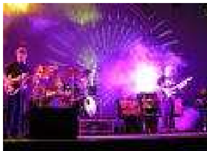
I Pink Floyd in concerto

conferendo alle loro esibizioni un'aura di grande teatralità e spettacolarità (a dispetto dell'indole abbastanza anonima dei musicisti). Per questo possono a buon diritto essere considerati il gruppo che meglio ha rappresentato, perlomeno nei primi anni della loro carriera (prima dell'allontanamento dello stesso Barret), il rock psichedelico.